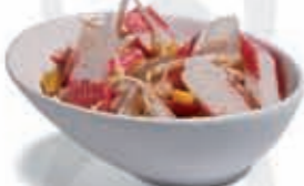
4. Cangrejo con soja 2.75 €