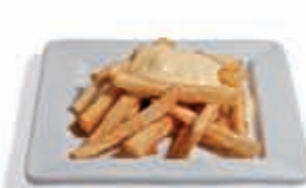
9. Patatas fritas con allioli suave 2.80 €