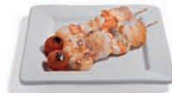
30. Pincho de rape y langostinos 4.30 €