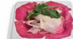
33. Carpaccio de buey con parmesano 3.05 €