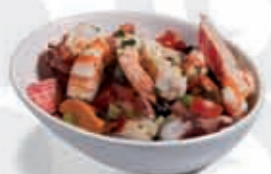
7. Salpicón de marisco 3.95 €