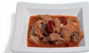
20. Callos 3.95 €