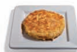
11. Tortilla de patatas 2.70 €