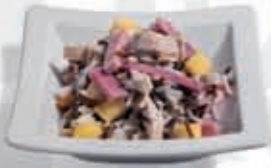
3. Dos arroces con jamón 2.85 €