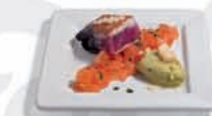
37. Atún a la plancha con aguacate 4.30 €