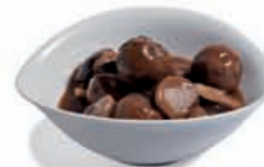
34. Albóndigas de ternera con ceps 3.70 €