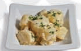
1. Patatas con allioli 2.60 €