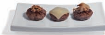
35. Hamburguesitas a la plancha: cebolla, mostaza y queso 3.40 €