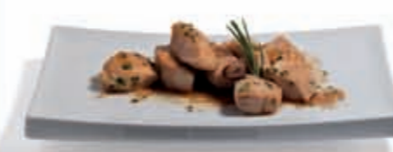
32. Dados de pechuga de pollo al ajillo 2.70 €