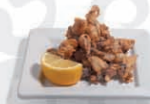
27. Chipirones fritos 5.60 €