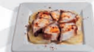
40. Pulpo a feira 7.95 €