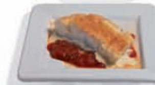
38. Bacalao gratinado con allioli 4.30 €