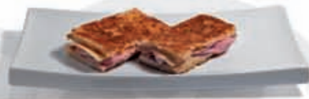
41. Bikini de jamón dulce y queso 2.90 €