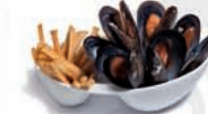
36. Mejillones al vapor con patatas 2.60 €