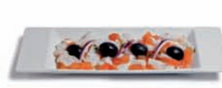
12. Esqueixada de bacalao 3.55 €