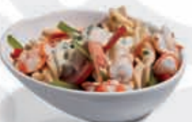
5. Pasta con langostinos 3.00 €