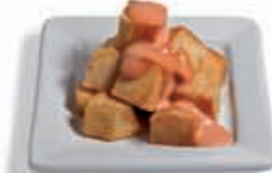
10. Bravas 2.70 €