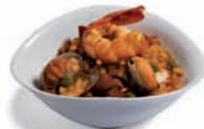
17. Paella de pescado y marisco 5.50 €