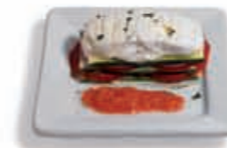
15. Milhojas de calabacín, tomate y queso 3.05 €