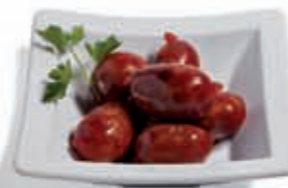
19. Choricitos 3.95 €