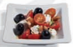
6. Tomate cherry con queso de cabra 3.15 €