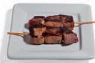
28. Pincho moruno 2.65 €