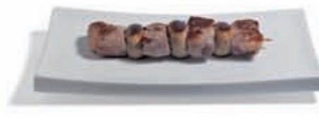
31. Pincho de Solomillo y champiñones 4.30 €