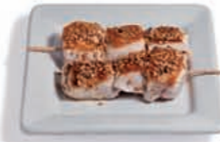
29. Pincho de pollo con soja y sésamo 2.65 €