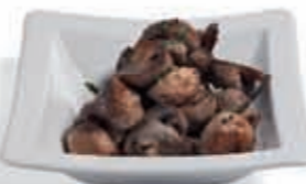
14. Champiñones con ajo y perejil 3.05 €