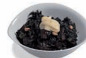
18. Arroz negro con sepia 4.50 €