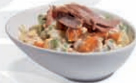
2. Rusa clásica con atún 2.70 €