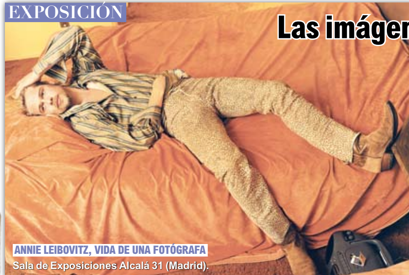
ANNIE LEIBOVITZ, VIDA DE UNA FOTÓGRAFA Sala de Exposiciones Alcalá 31 (Madrid).

Más de 200 fotos componen el recorrido artístico de la muestra Annie Leibovitz, vida de una fotógrafa . 1990-2005, que organiza la Comunidad de Madrid. La exposición, de entrada gratuita, ofrece fotografías de su vida y retratos de famosos. Puede visitarse hasta el 6 de septiembre.