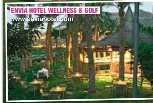
ENVÍA HOTEL WELLNESS & GOLF www.enviahotel.com